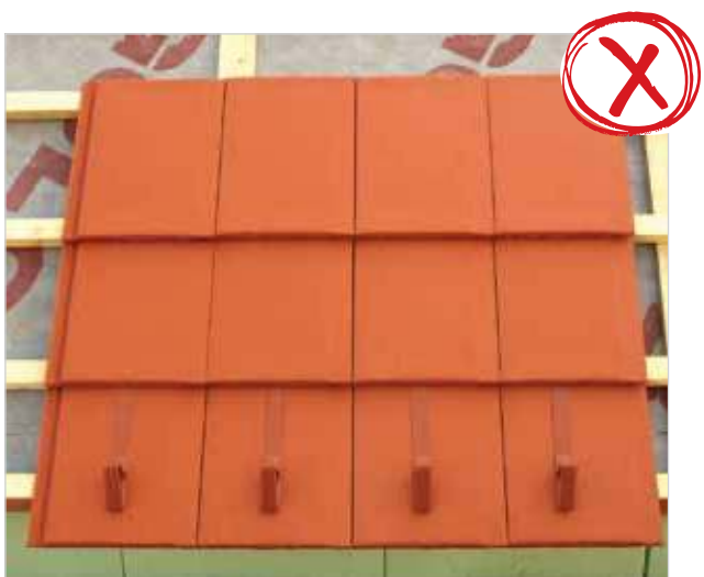
Napačno pokrivanje brez zamika.