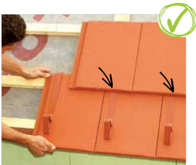
Pravilno pokrivanje z zamikom in pravilna montaža snegolovov.

Za lažjo predstavo si pogledjte spodnje slike.