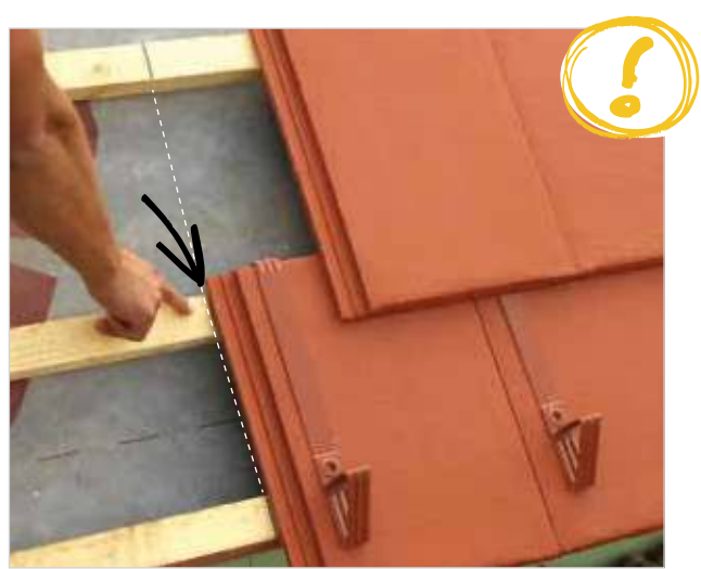
Iz dobavljenih strešnikov vzamemo štiri strešnike in preverimo pokrivno širino, ki jo z vrvičnim odtisom prenesemo na streho. Na sliki je viden vrvični odtis.