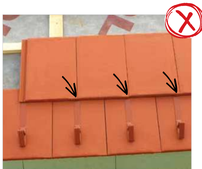
Napačna montaža snegolovov.